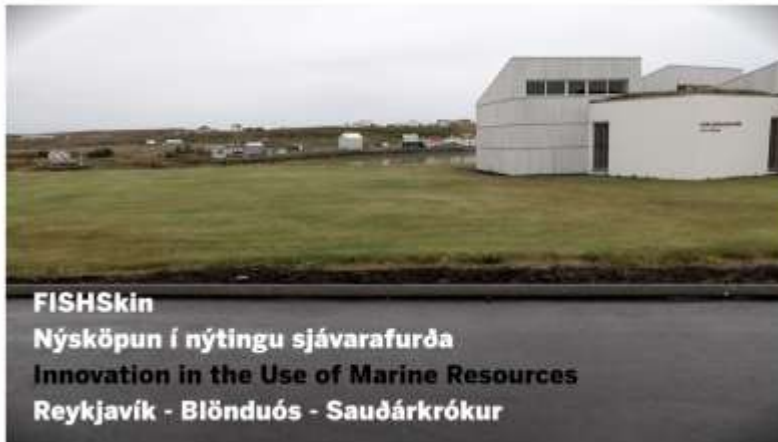
FISHSkin Nýsköpun í nýtingu sjávarafurða Innovation in the Use of Marine Resources Reykjavík - Blönduós - Sauðárkrókur