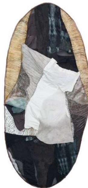
Affection on clothes 140 x 40 x 20 cm old clothes, satin, different metal wires clothes collage and metal wire knitting photo by Rex Cheung