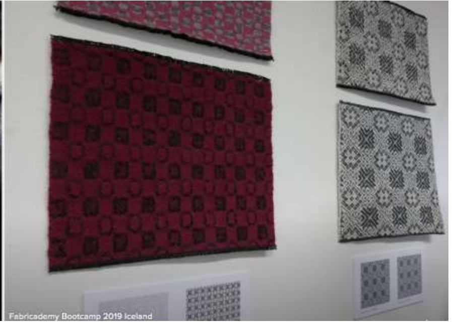
Fabricademy Bootcamp 2019 Iceland