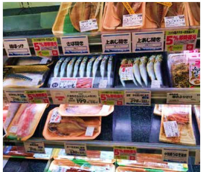
Loðna í hillum japanskrar verslunar.

Síldarhrogn eru framleidd í Danmörku, Þýskalandi,